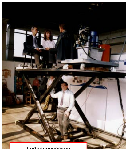
Гидравлический подъемник к спектаклю Мариинского театра «СЕМЕН КОТКО»