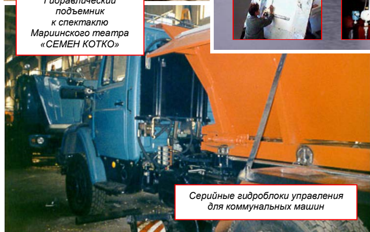
Серийные гидроблоки управления для коммунальных машин