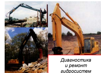
Диагностика и ремонт гидросистем