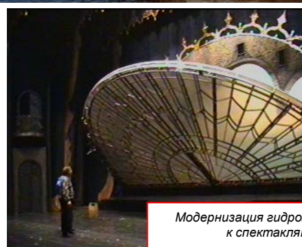
Модернизация гидроприводов подвижных декораций Мариинского театра к спектаклям «Обручение в монастыре» и «Война и мир»