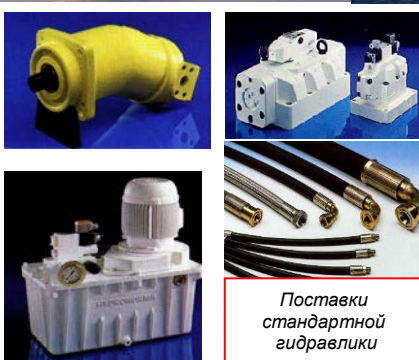
Поставки стандартной гидравлики