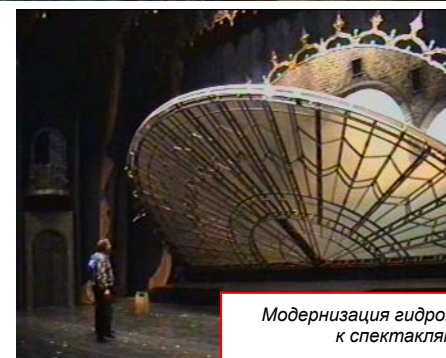
Модернизация гидроприводов подвижных декораций Мариинского театра к спектаклям «Обручение в монастыре» и «Война и мир»