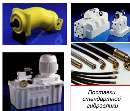
Поставки стандартной гидравлики