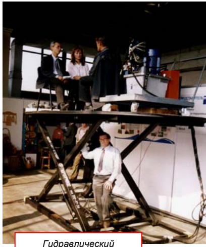
Гидравлический подъемник к спектаклю Мариинского театра «СЕМЕН КОТКО»