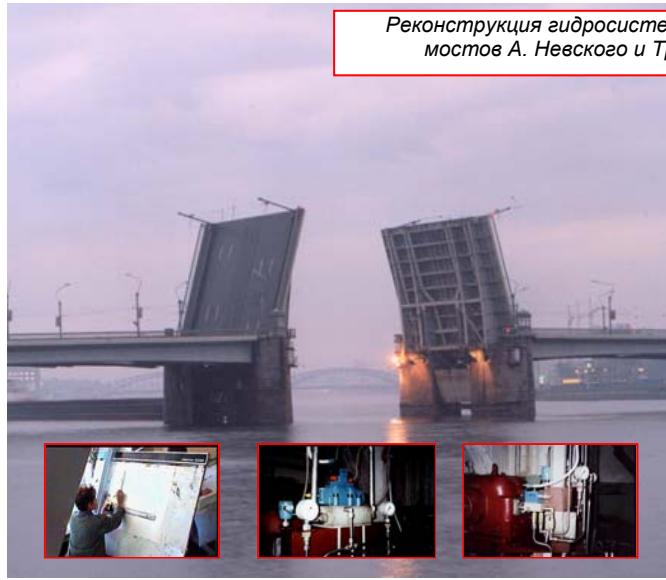
Реконструкция гидросистем разводных механизмов мостов А. Невского и Троицкого «под ключ».