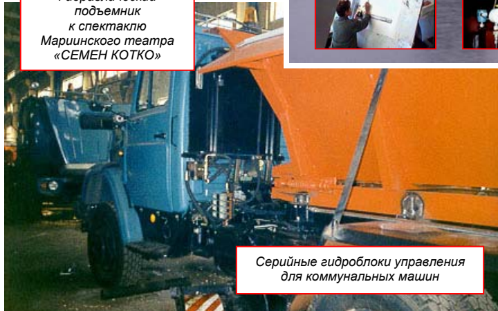
Серийные гидроблоки управления для коммунальных машин