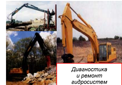
Диагностика и ремонт гидросистем